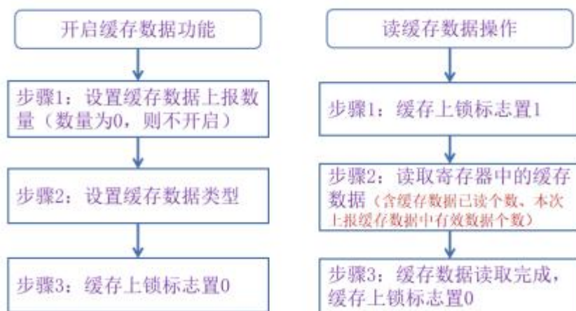
图 5-4 开启缓存数据功能与读缓存数据操作